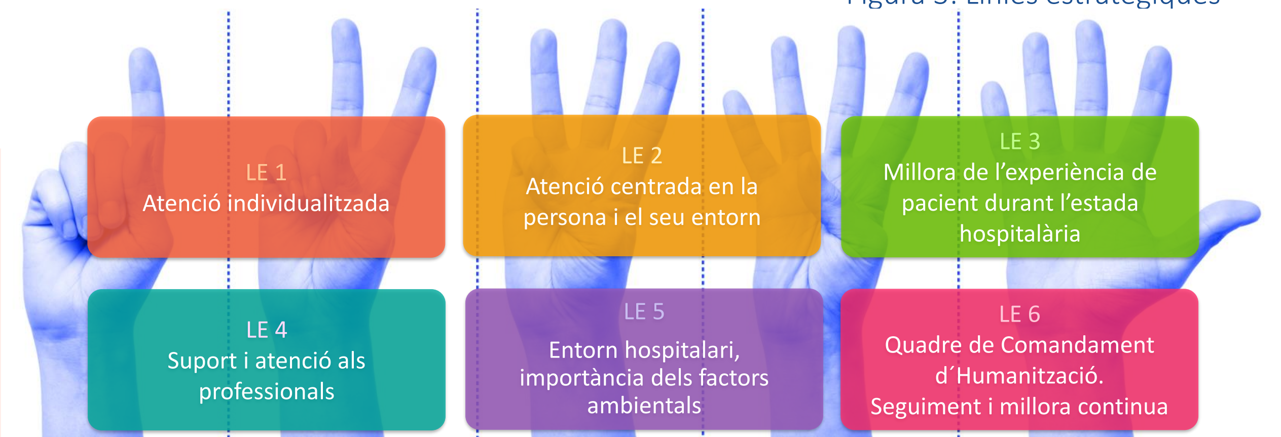
Figura 3: Línies estratègiques

Per a la implementació del PH, posem en marxa el pla d'acció anual a realitzar per la CH i per tots els professionals de l'HUVH, així com el mapatge actiu anual de les activitats dins del PE HUVH 2021-2025. A la figura 3 es poden observar els plans d'acció de 2022 de la CH: