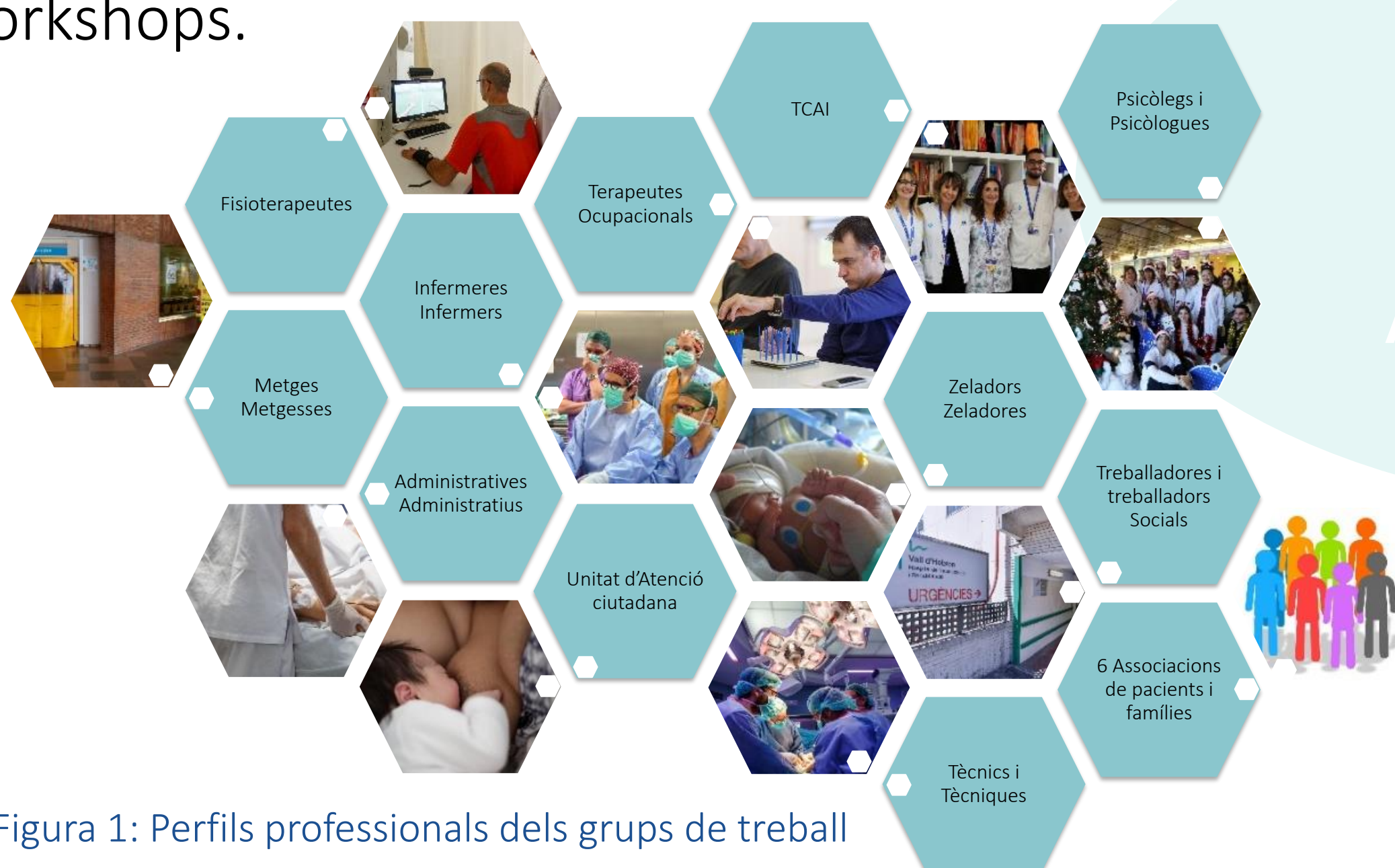
Figura 1: Perfils professionals dels grups de treball

Cada grup va realitzar tres workshops, dos d'anàlisi de la situació i un de propostes de millora. Dels 66 professionals, un 87% van participar en els 18 workshops.